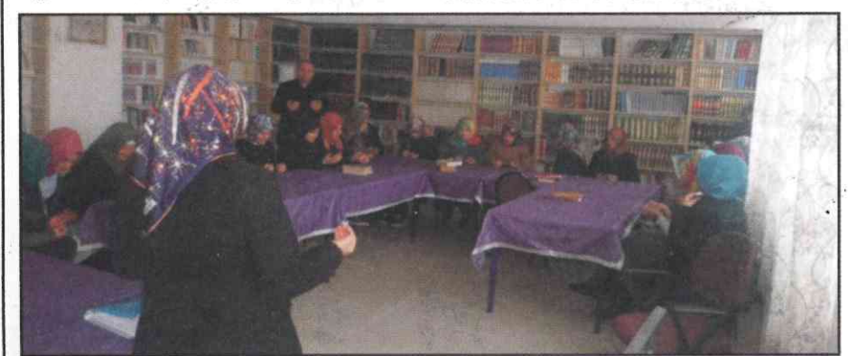
Sohbete dua ile başlanıp, Mesnevi'den beyitlerin açıklamasıyla devam edilmektedir.

gösterdiği sohbetlerimiz ikinci dönemde de devam edecektir.